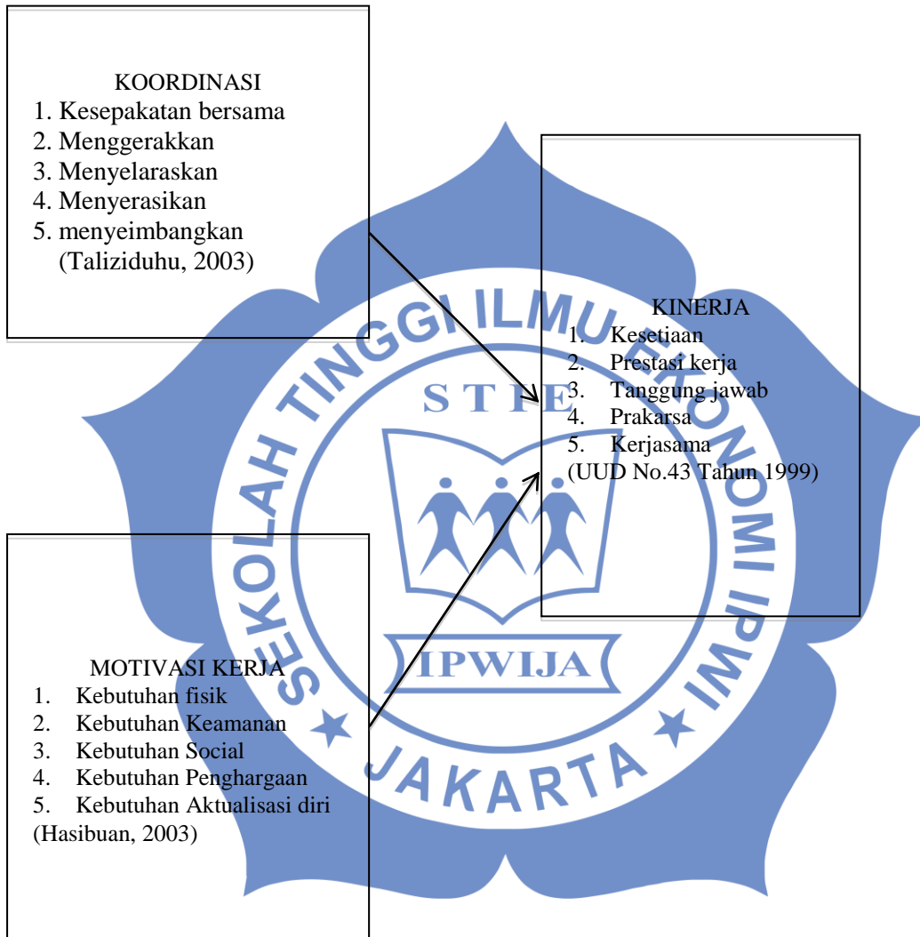
Gambar 2.1 Kerangka Pemikiran